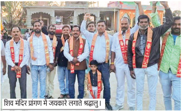
शिव मंदिर प्रांगण में जयकारे लगाते श्रद्धालु।