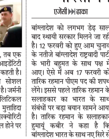
मुनीर अंदर जा रहे होते हैं, तब एक सिक्वोरिटी गाई उनसे आइडेंटिटी कार्ड सीधा करने के लिए कहती है। इस घटना का वीडियो सोशल मीडिया पर वायरल हो रहा है। जर्मनी के एक सिंधी पॉलिटेकल ऑर्गनाइजेशन, जय सिंध मुताहिदा महाज ने म्यूनिख सिक्वोरिटी कॉन्फ्रेंस में मुनीर के शामिल होने पर कड़ी आपत्ति जताई है।

पाकिस्तान आर्मी चीफ फोल्ड मार्शल असीम मुनीर की इंटरनेशनल लेवल पर भारी बेइज्जती हुई है। जर्मनी के म्यूनिख में एक इवेंट में सिक्वोरिटी ऑफिसर ने असीम मुनीर को उनके आइडेंटिटी कार्ड की वजह से रोका। फोल्ड मार्शल असीम मुनीर और उनकी टीम म्यूनिख सिक्वोरिटी कॉन्फ्रेंस में शामिल होने के लिए जर्मनी गए थे। यहां मुनीर को एंटी करने से पहले उनका आईडी कार्ड मांगा गया। म्यूनिख में चल रहे इवेंट में जब पाकिस्तान के आर्मी चीफ असीम