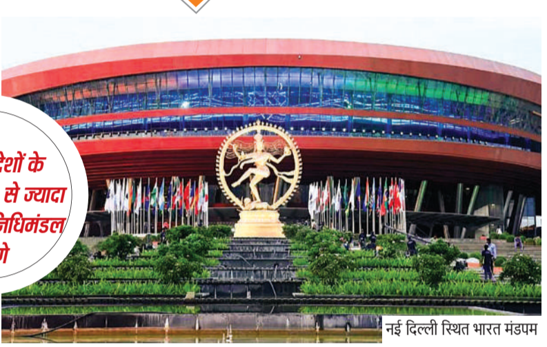
नई दिल्ली स्थित भारत मंडपम

6 10000 पुलिस जवानों की इवेंट और मेहमानों की सुरक्षा में तैनाती की गई है