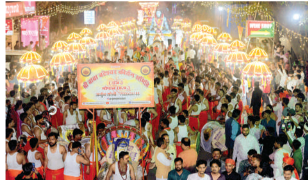
11 नंबर अरेरा कॉलोनी से निकाली गई शिव बारात में शामिल श्रद्धालु।