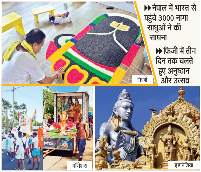
►नेपाल में भारत से पहुंचे 3000 नागा साधुओं ने की साधना ►फिजी में तीन दिन तक चलते हुए अनुष्ठान और उत्सव