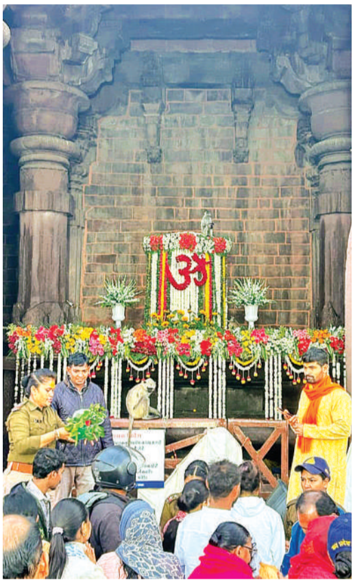
भोजपुर में भगवान भोजेश्वर का आकर्षण श्रृंगार किया गया।

महाशिवरात्रि पर मंदिरों में शिवजी के दर्शन के लिए लंबी कतारें