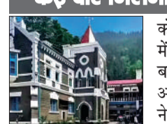
उत्तराखंड हाई कोर्ट

कोर्ट ने पाया कि दोनों पक्ष लंबे समय से रिश्ते में थे और उनके बीच बार-बार शारीरिक संबंध बने थे, जिससे प्रारंभिक धोखाधड़ी के बजाय आपसी सहमति का संकेत मिलता है। हाई कोर्ट ने यह निर्धारित किया कि ठोस आधार के अभाव में आपराधिक कार्यवाही जारी रखना आरोपी का उत्पीड़न होगा।