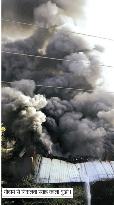
गोदाम से निकलता स्याह काला धुआं।

फायर फाइटर्स को करना पड़ी मशक्कत, दीवार तोड़ने जेसीबी बुलाई