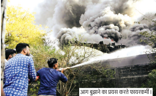
आग बुझाने का प्रयत्न करते फायरकर्मी।

भेल सीआईएसएफ, संत नगर, फतेहगढ़, गोविंदपुरा, मंडीदीप से पहुंची दमकलें