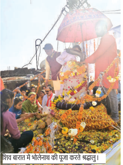
शिव बारात में भोलेनाथ की पूजा करते श्रद्धालु।