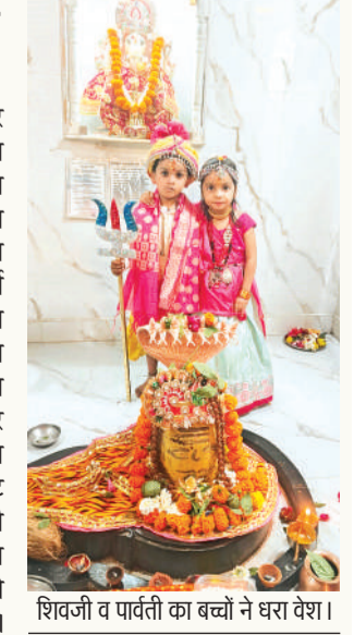
शिवजी व पार्वती का बच्चों ने धरा वेश।