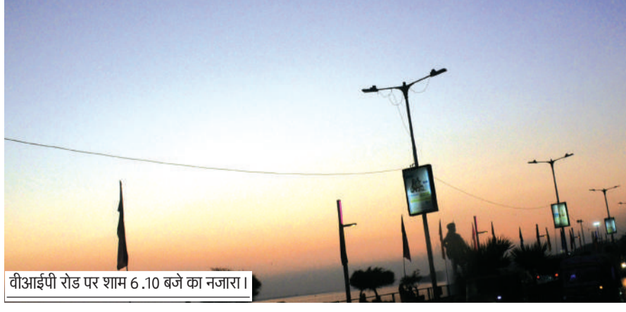
वीआईपी रोड पर शाम 6.10 बजे का नजारा।

भोपाल सहित 18 जिलों में पारा 30 डिग्री के पार धूप में आई तेजी: 35 डिग्री पर खंडवा अब रात का पारा भी तेजी से बदलेगा