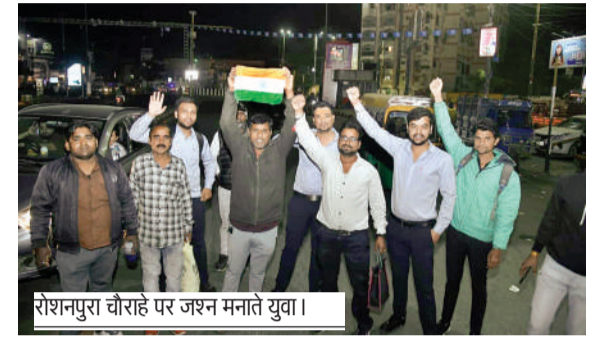
रोशनपुरा चौराहे पर जश्न मनाते युवा।

देर रात तक की आतिशबाजी सड़कों पर निकले युवा, मनाया टीम इंडिया की जीत का जश्न