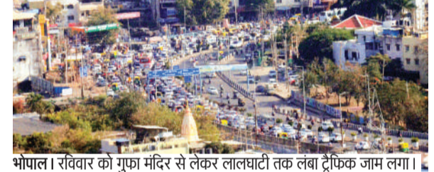
भोपाल। रविवार को गुफा मंदिर से लेकर लालघाटी तक लंबा ट्रैफिक जाम लगा।

प्रशासनिक कारणों से लिया गया निर्णय मेट्रो रेल कॉर्पोरेशन ने 56 पदों पर होने वाली भर्ती रद्द की