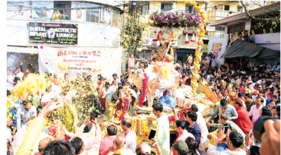
बड़वाले महादेव मंदिर से निकली शिव बारात में श्रद्धालुओं का हुजूम उमड़ पड़ा।

महाशिवरात्रि: दिनभर चलता रहा पूजा-पाठ का दौर, सुबह से शिवालयों में पहुंचे श्रद्धालु ▶ राजधानी में 40 से अधिक स्थानों से धूमधाम से निकली शिव बारात ▶ जगह-जगह भंडारे व कन्या भोज हुए