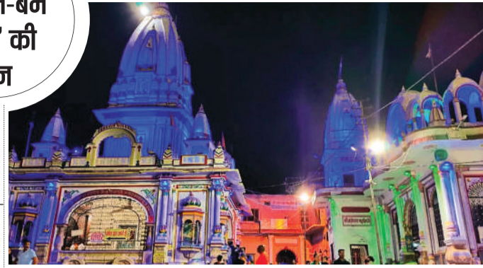
हरिद्वार कनकलाल स्थित दक्षेश्वर महादेव मंदिर, जिसे भगवान शिव की ससुराल माना जाता है

सभी शिवालयों में गूंजा हर-हर महादेव राष्ट्रपति और उपराष्ट्रपति ने भी दी बधाई