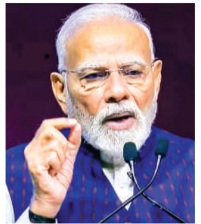
प्रधानमंत्री नरेंद्र मोदी

प्रधानमंत्री नरेंद्र मोदी ने एक विशेष इंटरव्यू में कहा कि उनकी सरकार ने सुधारों को पूरी प्रतिबद्धता के साथ लागू किया है और यह सिर्फ बातों तक नहीं बल्कि काम में भी दिखा है। इस साल का बजट भारत के विकसित राष्ट्र बनने की आकांक्षा को दर्शाता है।