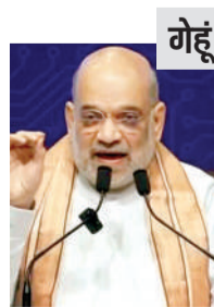
केंद्रीय गृह मंत्री अमित शाह