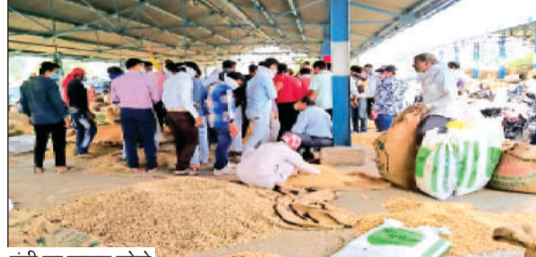
मंडी का फाइनल फोटो

देखते हुए बड़ी राहत की उम्मीद कम है, लेकिन नए टैक्स न लगाए जाएं, यही बड़ी राहत होगी। उन्होंने नगर निगम की कार्यप्रणाली पर भी सवाल उठाए। टैक्स पूरा लिया जाता है, लेकिन सफाई, सड़क और पानी की व्यवस्था कमजोर है। सरकार को जल और स्वच्छता पर ज्यादा खर्च करना चाहिए। व्यापारी संगठनों का कहना है कि जीएसटी लागू होने के बाद भी भोपाल में अलग से लगने वाला कमर्शियल टैक्स व्यापारियों पर अतिरिक्त बोझ है। इस टैक्स पर रोक लगनी चाहिए। हम कोर्ट तक गए, लेकिन अब भी राहत नहीं मिली। अगर इसे खत्म किया जाए तो व्यापारियों को बड़ी राहत मिलेगी। उन्होंने स्टांप ड्यूटी को लेकर भी असमंजसता का मुद्दा उठाया। उनका कहना है कि इंडस्ट्रियल सेक्टर को करोड़ों के लोन पर बेहद कम स्टांप ड्यूटी देनी पड़ती है, जबकि व्यापारी को लोन लेने से पहले भारी स्टांप ड्यूटी चुकानी पड़ती है। इसे खत्म या कम किया जाए, तभी व्यापार को गति मिलेगी। हर साल उम्मीद रहती है, लेकिन राहत नहीं मिलती। उन्होंने मांग की कि मंडी टैक्स पूरी तरह खत्म हो। एक तरफ जीएसटी ले रहे हैं, दूसरी तरफ मंडी टैक्स भी यह दोहरी मार है। उन्होंने पेट्रोल और डीजल को भी जीएसटी के दायरे में लाने की मांग की। साथ ही दालों के आयात पर अधिक एक्सपोर्ट, इंपोर्ट ड्यूटी में कमी और किसानों को सीधी राहत देने की बात कही।