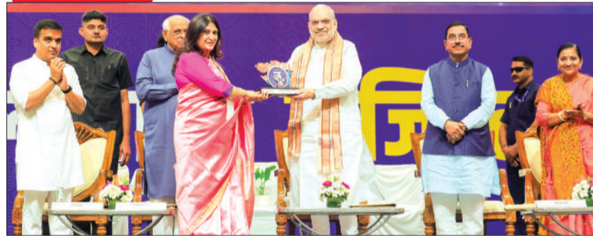
गुजरात के गांधीनगर में एक कार्यक्रम के दौरान केंद्रीय गृह और सहकारिता मंत्री अमित शाह

मनमोहन सरकार ने डकल प्रस्ताव पर साइन कर दिए बाजार खोला पीएम मोदी किसानों की सुरक्षा के लिए चढ़ाने की तरह खड़े हुए