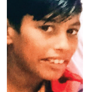
निजी स्कूल में सातवीं कक्षा का छात्र था जबकि उससे बड़ा 14 साल का बेटा है।