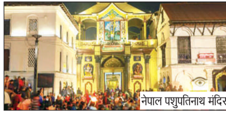
नेपाल पशुपतिनाथ मंदिर