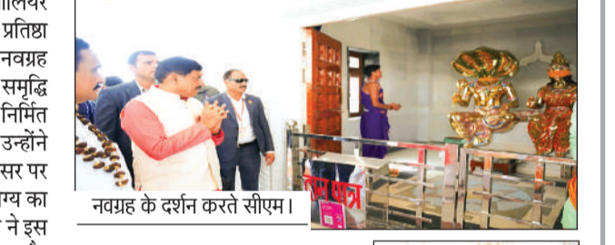
नवग्रह के दर्शन करते सीएम।

संतों के समागम का अवसर सौभाग्य की बात: डॉ. मिश्रा पूर्व मंत्री डॉ. नरोत्तम मिश्र ने नवग्रह शक्तिपीठ के प्राण-प्रतिष्ठा समारोह में मुख्यमंत्री और अन्य अतिथियों का स्वागत करते हुए कहा कि डबरा में इस प्रकार के पूर्ण होने और संतों के समागम का अवसर सौभाग्य की बात है।