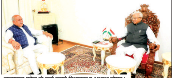
राज्यपाल पटेल से चर्चा करते विधानसभा अध्यक्ष तोमर।

हरिभूमि न्यूज गोपाल राज्यपाल मंगुभाई पटेल से मध्यप्रदेश विधानसभा के अध्यक्ष नरेन्द्र सिंह तोमर ने रविवार को लोकभवन में सौजन्य भेंट की। राज्यपाल पटेल का तोमर ने