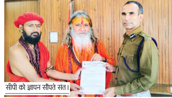
सीपी को ज्ञापन सौंपते संत।

पुलिस आयुक्त को ज्ञापन सौंपकर की कार्यवाई की मांग भोपाल में सम्मेलन में पहली किन्नर शंकराचार्य घोषित करने पर साधु-संत विरोध में उतरे