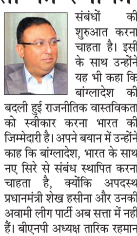
संबंधों की सुदृढता करना चाहता है। इसी के साथ उन्होंने यह भी कहा कि बांग्लादेश की बदली हुई राजनीतिक वास्तविकता को स्वीकार करना भारत की जिम्मेदारी है। अपने बयान में उन्होंने कहा कि बांग्लादेश, भारत के साथ नए सिरे से संबंध स्थापित करना चाहता है, क्योंकि अपदस्थ प्रधानमंत्री शेख हसीना और उनकी अन्धमौलीय पार्टी अब सत्ता में नहीं हैं। बीएनपी अध्यक्ष तारिक रहमान