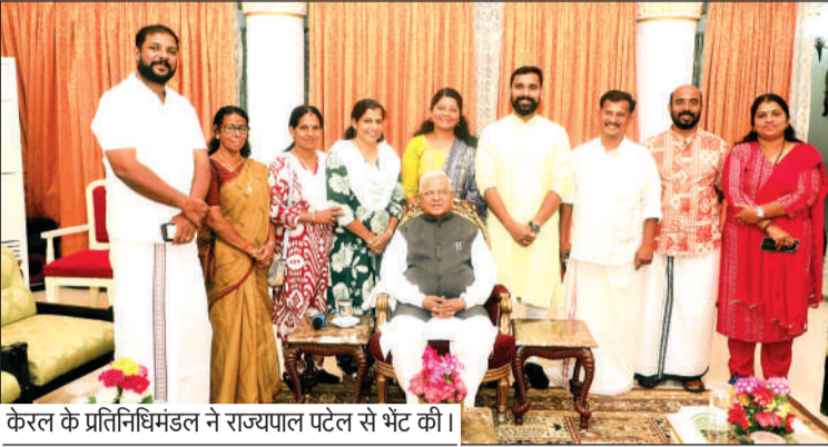
केरल के प्रतिनिधिमंडल ने राज्यपाल पटेल से भेंट की।

मध्यप्रदेश भ्रमण के अनुभव साझा किए। देश की स्वच्छता राजधानी के रूप में भोपाल के सफाई प्रबन्धन की सराहना की। प्रदेश के जल प्रबन्धन, स्मार्ट सिटी परियोजना, कचरा