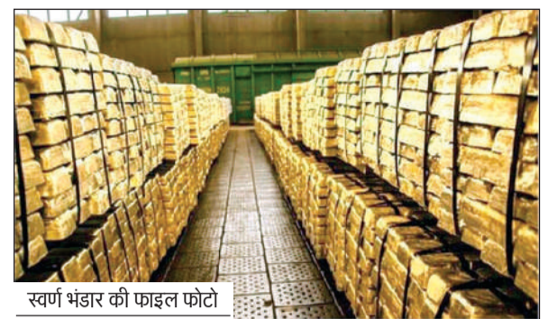
स्वर्ण भंडार की फाइनल फोटो

भारतीय रिजर्व बैंक (आरबीआई) द्वारा जारी ताजा आंकड़ों ने आर्थिक जगत को हैरान कर दिया है। लगातार चार हफ्तों की जोरदार बढ़त के बाद देश के विदेशी मुद्रा भंडार में भारी गिरावट दर्ज की गई है। सबसे चौंका देने वाली बात यह है कि मात्र एक सप्ताह के भीतर देश के स्वर्ण भंडार की वैल्यू में 14 बिलियन डॉलर (करीब 1.28 लाख करोड़ रुपए) से ज्यादा की कमी आई है। आरबीआई के अनुसार 6 फरवरी को समाप्त हुए सप्ताह में भारत का कुल विदेशी मुद्रा भंडार 6.711 अरब डॉलर घटकर 6.711 अरब डॉलर रह गया है। इससे पिछले सप्ताह यह 723.774 अरब डॉलर के अपने सर्वकालिक उच्चतम स्तर पर था।