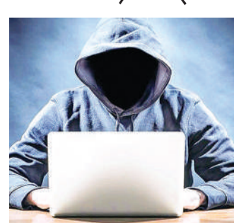
जालसाज दो लाख 57 हजार रुपए फरियादी के खाते से निकाल चुके थे। सायबर सेल ने जांच के बाद जीरो पर प्रकरण दर्ज कर डायरी छोला मंदिर पुलिस को भेजी है। फिलहाल फरियादी के बयान दर्ज नहीं हो सके हैं।

छोला मंदिर पुलिस ने 69 साल के बुजुर्ग की शिकायत पर अज्ञात साइबर जालसाज के खिलाफ धोखाधड़ी की धाराओं के तहत प्रकरण दर्ज किया है। दरअसल आरोपियों ने फरियादी को एक एपीके (एन्ड्रॉयड पैकेज किट) फाइल वाट्सएप पर भेजी थी। फाइल डाउनलोड करते ही उनका मोबाइल हैक हो गया। साइबर सालसाज उनके बैंक खाते से प्रतिदिन 25 हजार रुपए अपने खातों में ट्रांसफर करने लगा। संदेह होने पर बैंक की ओर से ही बुजुर्ग को कॉल कर सूचना दी गई। बाद में बैंक की ओर से होल्ड करने पर रकम निकालने का सिलसिला बंद हो सका। तब तक